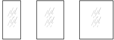
CFTG4C TT40GC CFTG6C-TT60GC CFTG8C-TT80GC